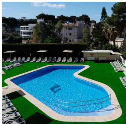
THB María Isabel****