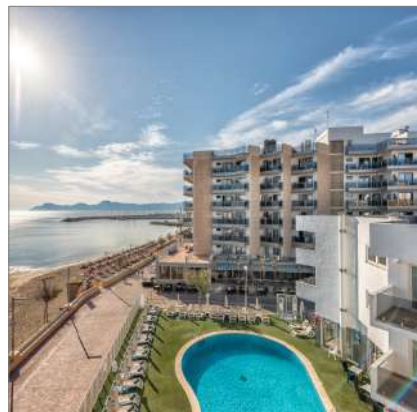
THB Gran Bahía****