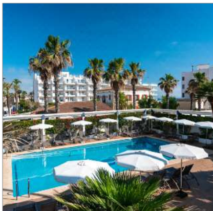
THB Gran Playa****