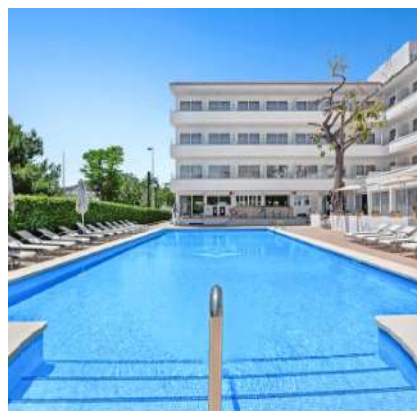
THB Dos Playas****