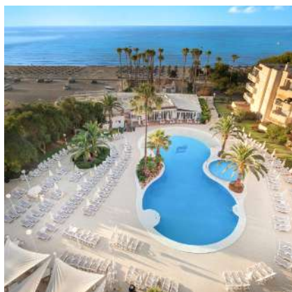
THB Sa Coma Platja****