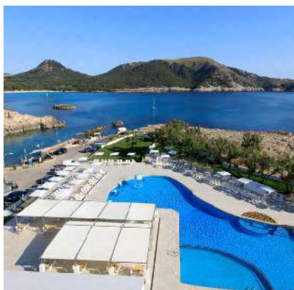
THB Cala Lliteras****