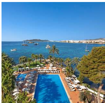
THB Los Molinos****