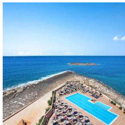
THB Sur Mallorca****