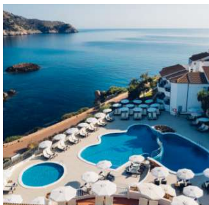
THB Guya Playa****