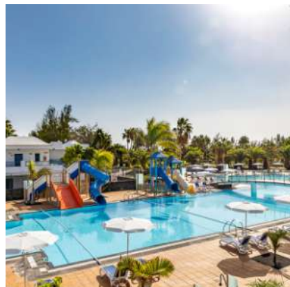
THB Tropical Island****