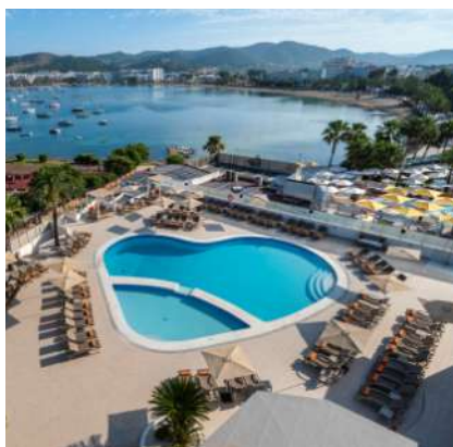
THB Ocean Beach****