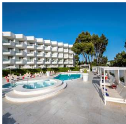
THB Naeco Ibiza****