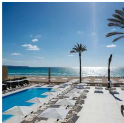
THB El Cid****