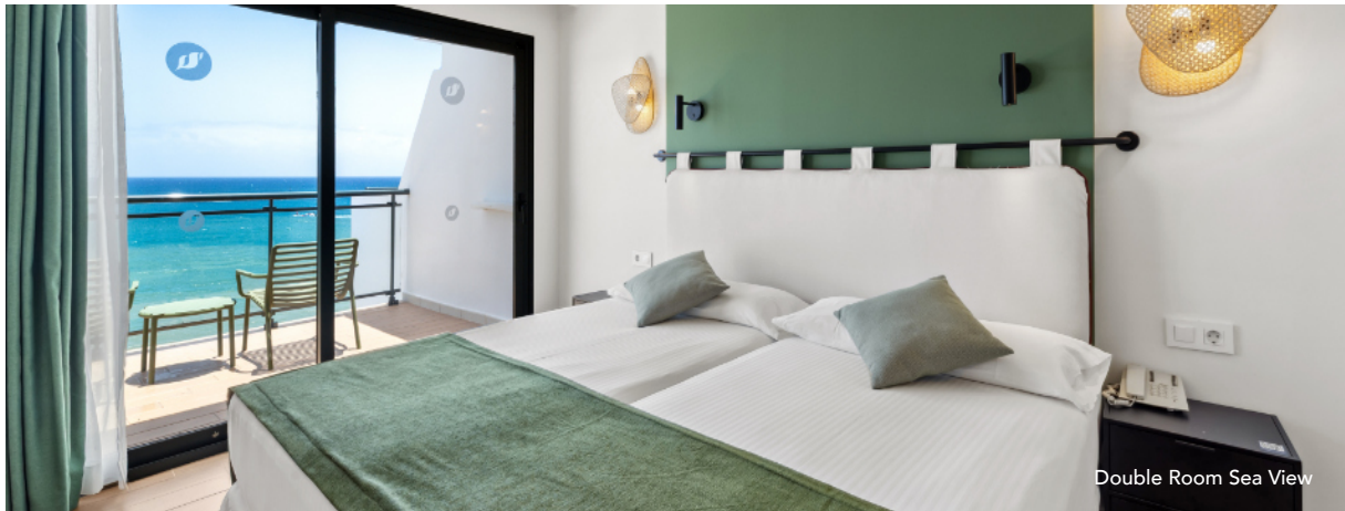
Double Room Sea View