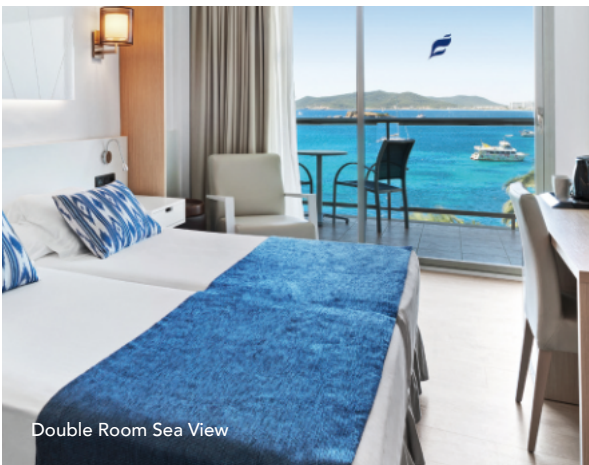
Double Room Sea View