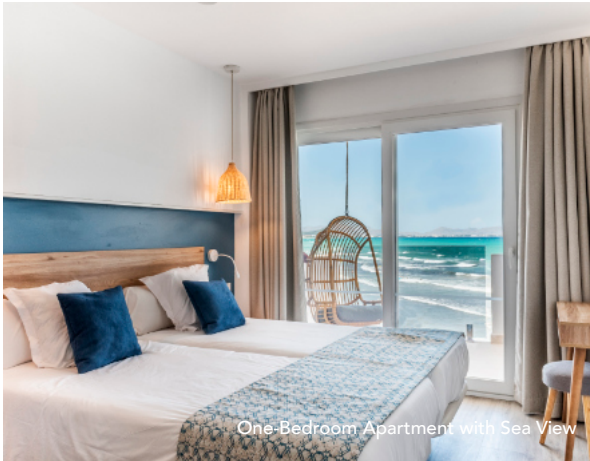
One-Bedroom Apartment with Sea View