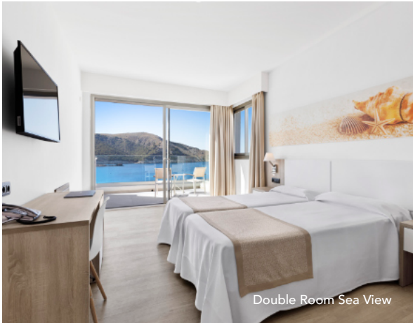
Double Room Sea View