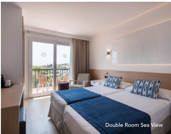
Double Room Sea View