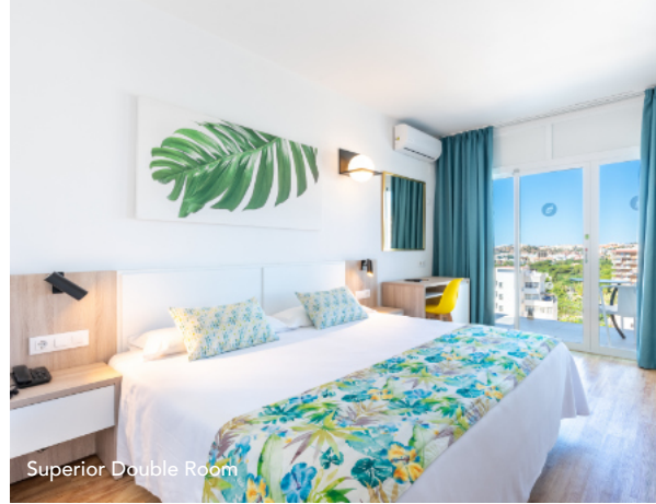
Superior Double Room