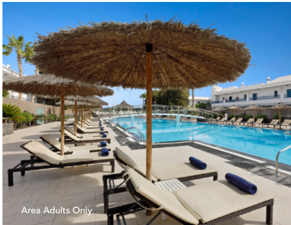
Area Adults Only