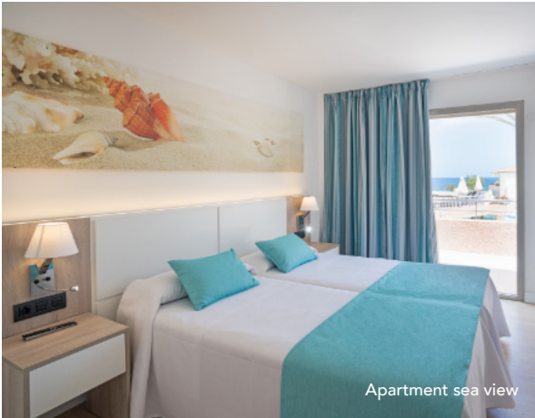
Apartment sea view